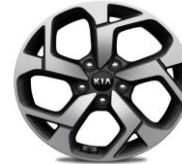
Cerchi in lega 17" 225/60R17