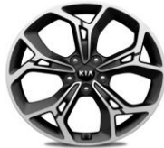
Cerchi in lega 19" GT Line 245/45R19