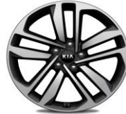
Cerchi in lega 19" 245/45R19